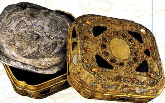
「鏡箱・鸚鵡牡丹文鏡」10世紀前半 内蒙古文物考古研究所

被葬者の正体をめぐって議論がされているが、豪華な副葬品から契丹皇族であることはわかっている。世界初公開となる副葬品の数々を展示。