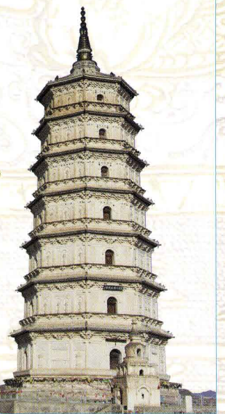
参考写真：慶州白塔