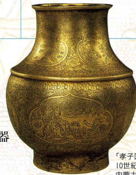
「孝子図壺」 10世紀前半 内蒙古文物考古研究所