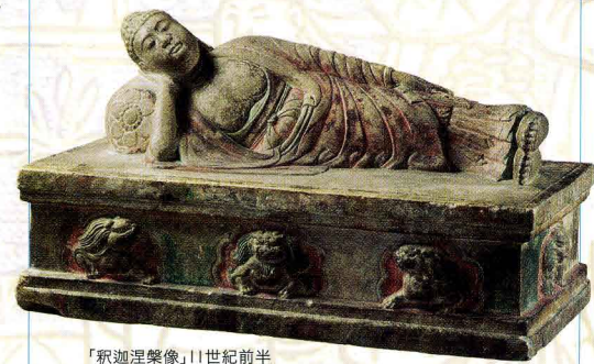
「釈迦涅槃像」11世紀前半 巴林右旗博物館