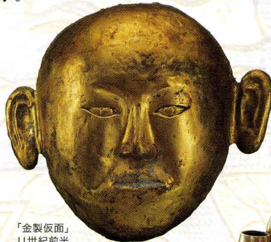
「金製仮面」 11世紀前半 内蒙古文物考古研究所

このプリンセスは夫とともに並んで葬られていた。その血統にふさわしい華麗な品々を展示。