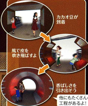
カカオ豆が到着 風で皮を吹き飛ばすよ 香ばしさを引き出そう 他にもたくさんの工程があるよ!

日本には江戸時代後期までにチョコレートが伝わり、明治時代に国内生産が始まりました。みんなが大好きなあの商品の、懐かしいテレビコマーシャルやパッケージもずらり展示。