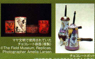
マヤ文明で使用されていたチョコレート容器(複製) © The Field Museum, Replicas Photographer: Amelia Larsen チョコレートポット (前田商店製、日本洋菓子協会連合会提供)

約4000年もの長い歴史の中で、にが~いカカオの飲み物から、おいしい食べ物になったチョコレート。昔の人は、どんな道具や食器でチョコレートを楽しんでいたのでしょうか?