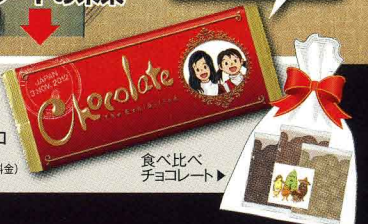
あなたの写真入りチョコレートが作れるコーナーもあります(有料) 食べ比べチョコレート

第2会場には、展覧会オリジナルチョコレートや、珍しいチョコレート、かわいいチョコレート雑貨などの販売コーナーがあります。デカチョコや、食べ比べチョコなど楽しさいっぱい!(商品は別料金)