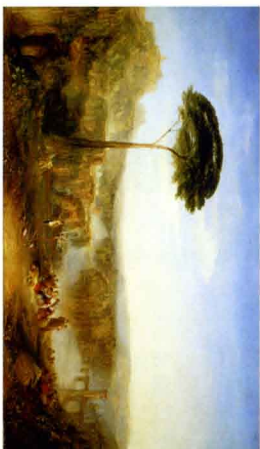
《チャールズ・ハロルドの巡礼―イタリヤ》 1832年発表 油彩、カンヴァス 142.2 x 248.3cm

1900年から約2年間英国に留学した夏目漱石は、ターナーの作品を愛し、小説や論考でたびたび言及している。「坊っちゃん」で、教頭の赤シャツが瀬戸内海の小島の松を見て「ターナーの画にありそうだね」と述べる場面がある。これのもとになったと考えられる作品のひとつが、《チャールズ・ハロルドの巡礼―イタリヤ》である。