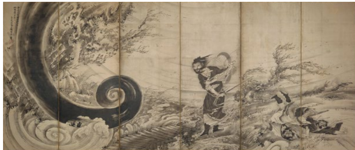
曾我蕭白 《風仙図屏風》 江戸時代、1764年(宝暦14年/明和元年)頃 六曲一隻、紙本墨画 Fenollosa-Weld Collection, 11.4510