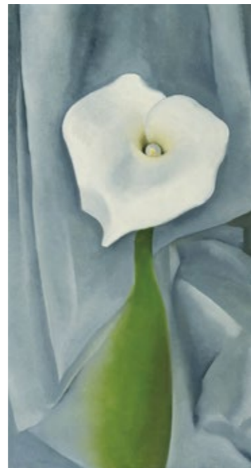
ジョージア・オキーフ 《グレーの上の カラ・リリー》 1928年 油彩、カンヴァス Gift of the William H. Lane Foundation, 1990.431 © 2017 Georgia O'Keeffe Museum / ARS N.Y. / JASPAR Tokyo E2485