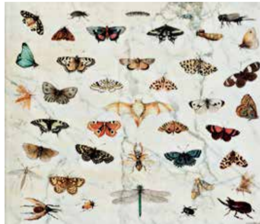
ヤン・ファン・ケッセル1世《蝶、カブトムシ、コウモリの習作》1659年 Private Collection, USA