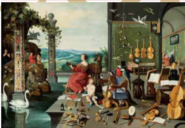
ヤン・ブリューゲル2世《聴覚の寓意》1645-1650年頃 Private Collection