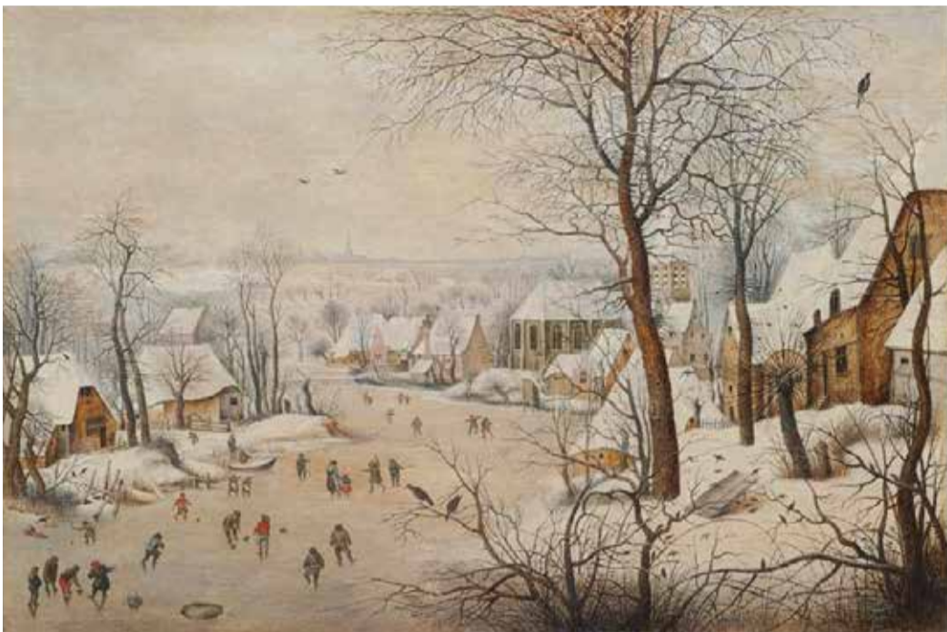
ピーテル・ブリューゲル2世《鳥園》1601年 Private Collection, Luxembourg