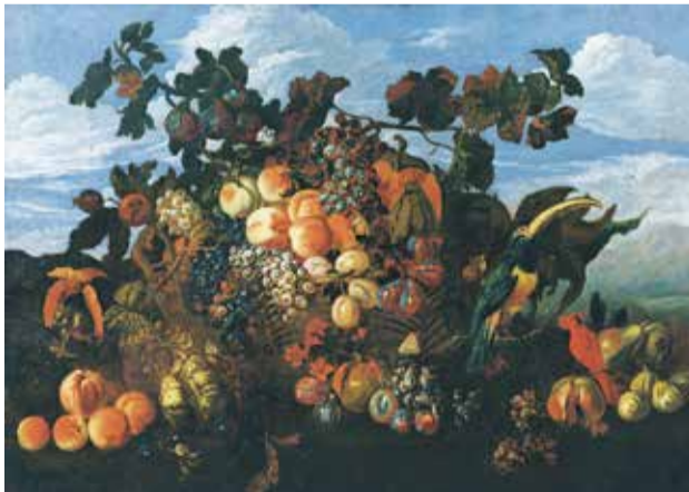
アブラハム・ブリューゲル《果物の静物がある風景》1670年 Private Collection