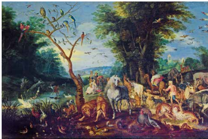
ヤン・ブリューゲル1世《ノアの箱舟への乗船》1615年頃 Anhaltische Gemäldegalerie Dessau