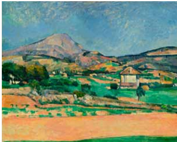
▲ポール・セザンヌ《サント＝ヴィクトワール山の平野、ツァルクロからの眺め》1882-85年