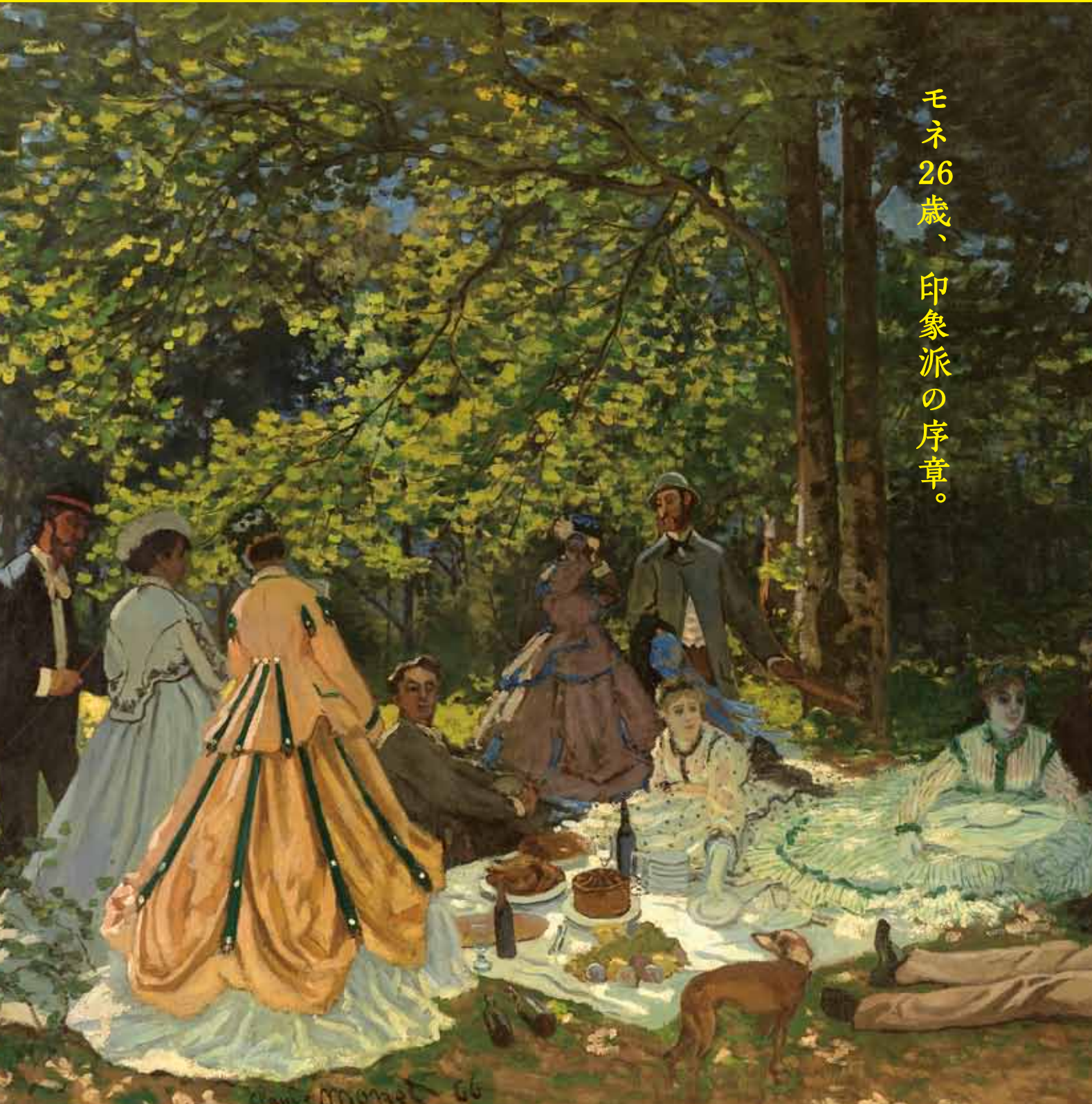
モネ 26 歳、印象派の序章。