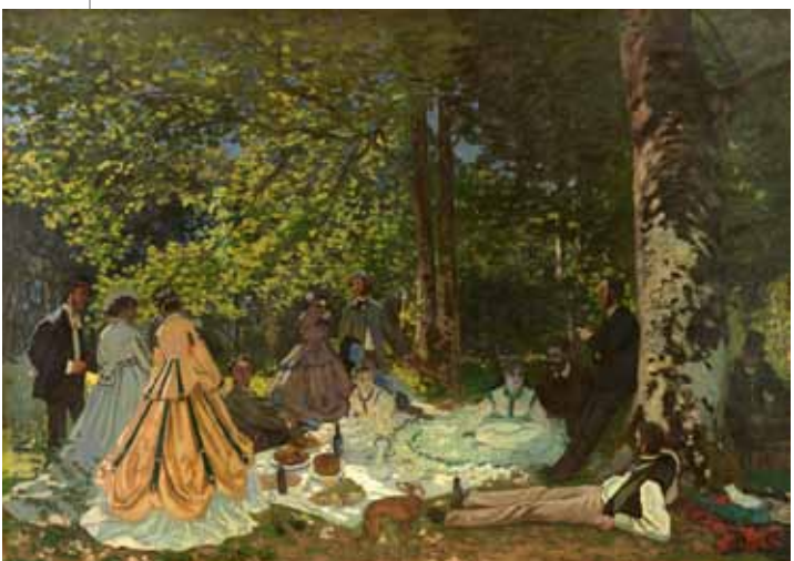
▲クロード・モネ《草上の昼食》1866年