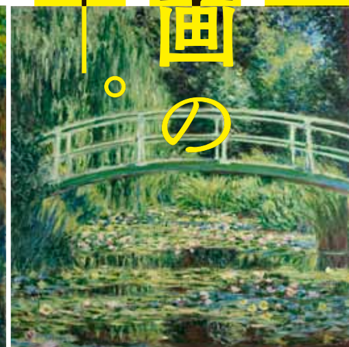
▲クロード・モネ《白い睡蓮》1899年