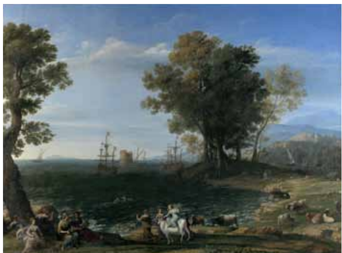
▲クロード・ロラン《エウロペの掠奪》1655年