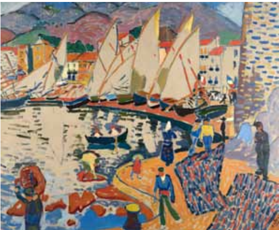
▲アンドレ・ドラン《港に並ぶヨット》1905年