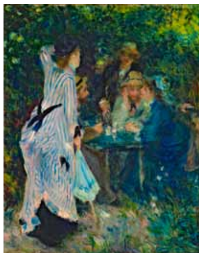
▲ピエール＝オーギュスト・ルノワール《庭にて、ムーラン・ド・ラ・ギャレットの木陰》1876年