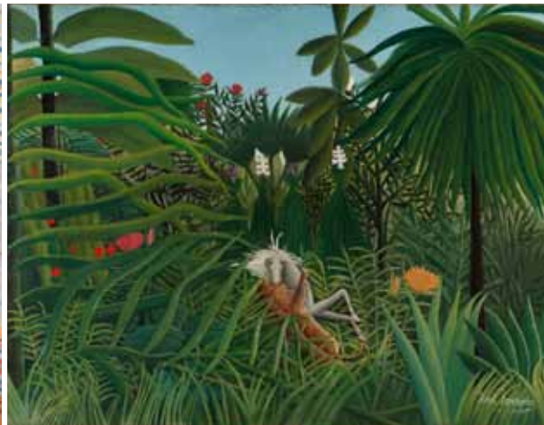
▲アンリ・ルソー《馬を襲うジャガー》1910年