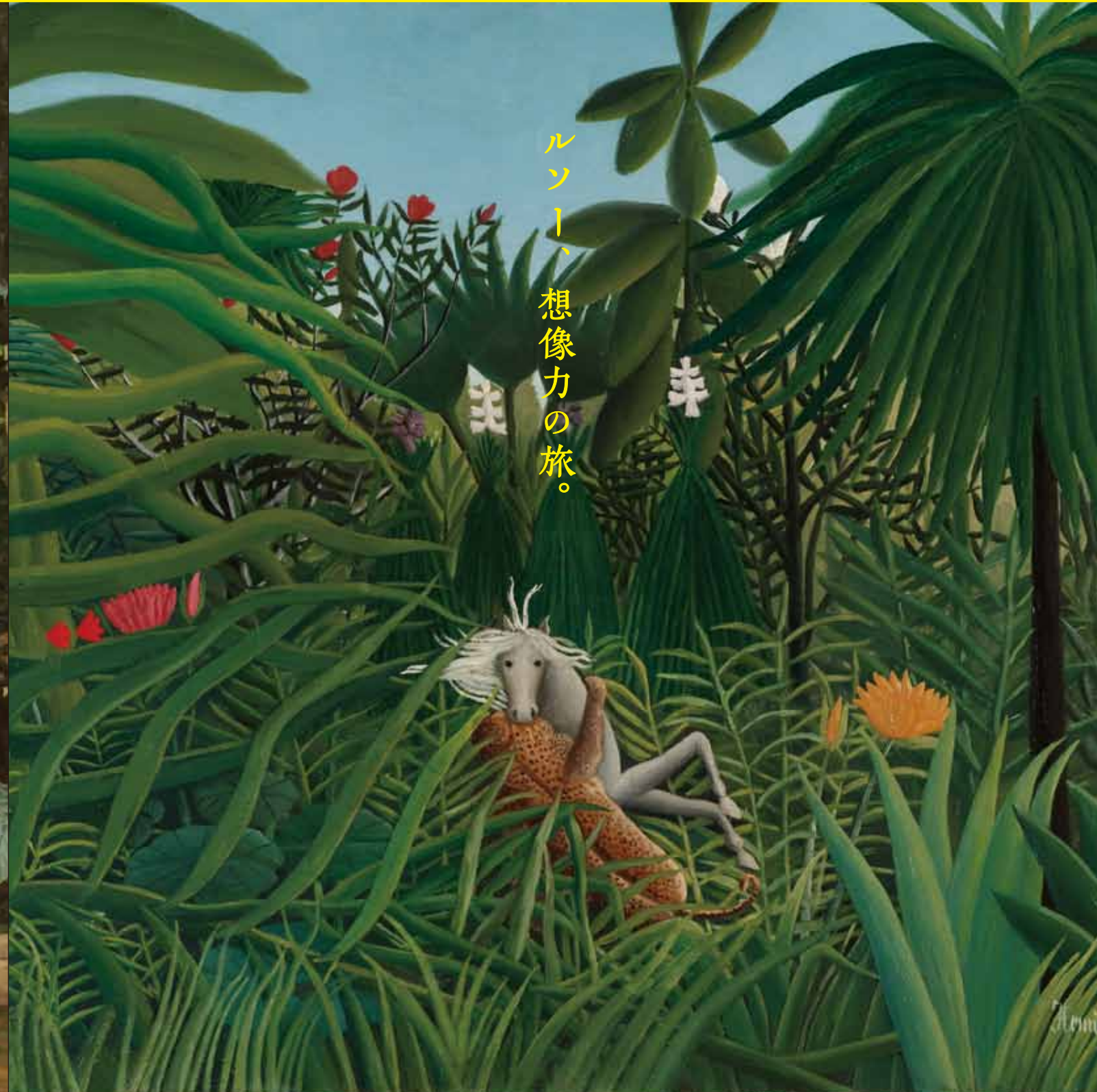
ルソー、想像力の旅。