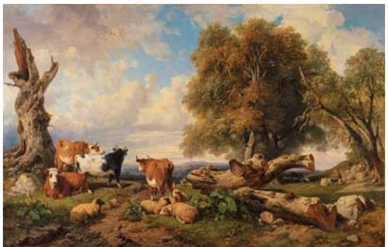
▲ジュール・コワニエ/ジャック・レイモン・プラスカサット《牛のいる風景》19世紀前半