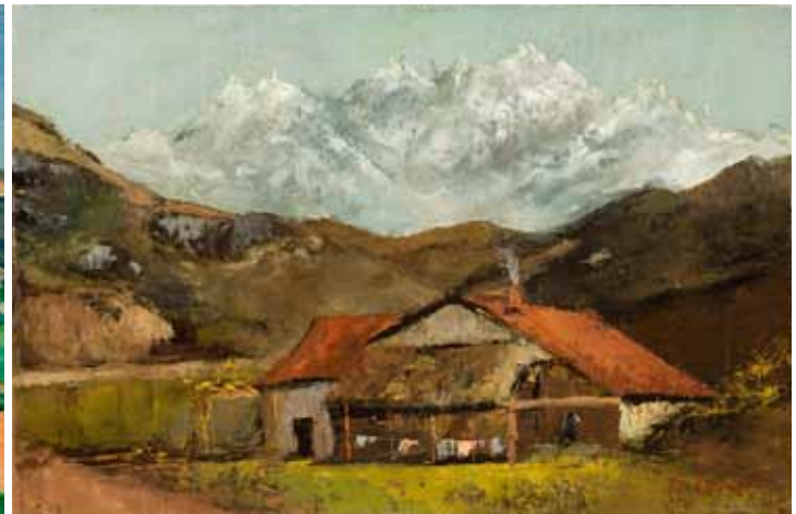
▲ギュスターヴ・クールベ《山の小屋》1874年頃